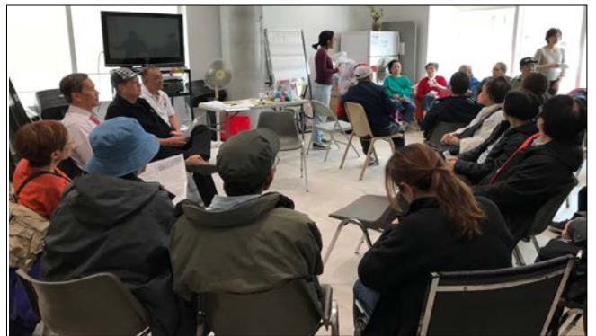
在协群中心与华人社区成员针对反对法律援助削減的社区会议

除此之外，没有法律代表的人，有很大的机会无法公平与拥有法律代表的另一方竞争，例如国家政府。这将会影响众人平等以及司法权益。另外，研究显示，每一块钱投资在法律援助服务上，政府将可以省下每6块钱在街友、健康、婚姻破裂以及刑期上的花费。