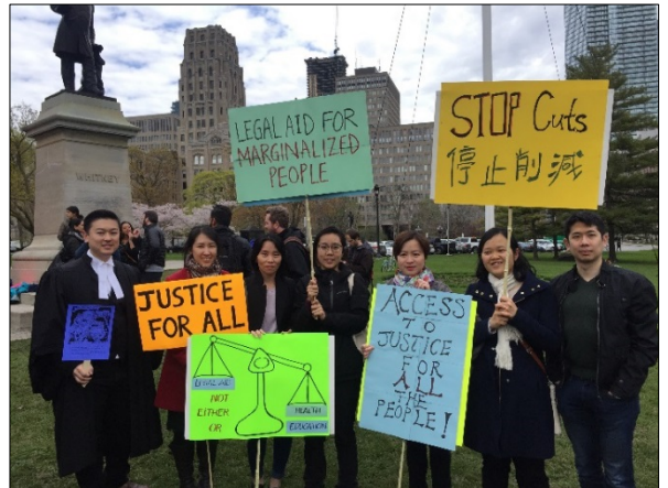
Thành viên Hội Đồng Quản Trị và nhân viên CSALC tham gia đấu tranh vận động Ngưng Cắt Giảm trước Queen's Park

Mặc dù Trung tâm tạm thời thoát hiểm trong sự cắt giảm bất lợi này, nhưng nếu LAO không tăng ngân sách trong năm nay có thể buộc chúng tôi phải sa thải nhân viên và giảm bớt dịch vụ. Vì hợp đồng thuê văn phòng hiện tại của chúng tôi sẽ hết hạn vào ngày 30 tháng 9 năm 2019, bắt đầu ngày 1 tháng 10, 2019, tiền thuê mới sẽ gia tăng 250%. Chúng tôi đặc biệt yêu cầu LAO giúp kinh phí cho chúng tôi trang trải tiền thuê mới đến cuối năm nhưng bị từ chối. Chúng tôi đã nộp đơn kháng cáo chính thức yêu cầu LAO xét lại quyết định bác hỗ trợ tiền thuê và chúng tôi đang chờ quyết định cuối cùng của LAO.