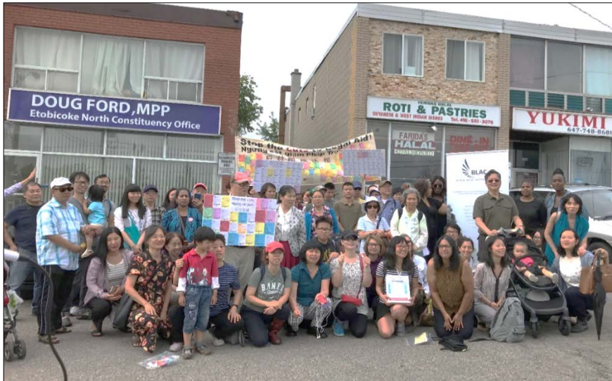
Day of Action: Ride for Justice - July 30, 2019

To get involved in our stop legal aid cut campaign, please fill out the form: https://urlzs.com/RStE