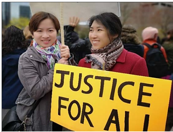
Luật sư và sinh viên thực tập pháp lý kêu gọi “Tiếp cận Công Lý cho Mọi Người”.