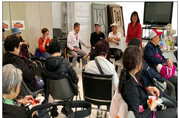
A community meeting for STOP LEGAL AID CUTS for Vietnamese community members at S.E.A.S Centre