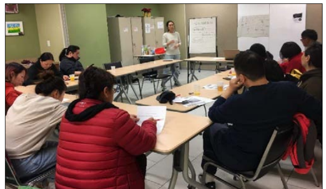
在士嘉堡与华人社区成员针对反对法律援助削減的社区会议