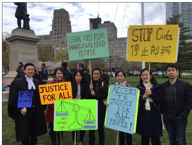
CSALC staff and Board Members participated in a general strike at Queen's Park

The cuts of this magnitude will have a serious impact on low income Ontarians, racialized community, immigrants, refugees, people with precarious status and other marginalized groups.