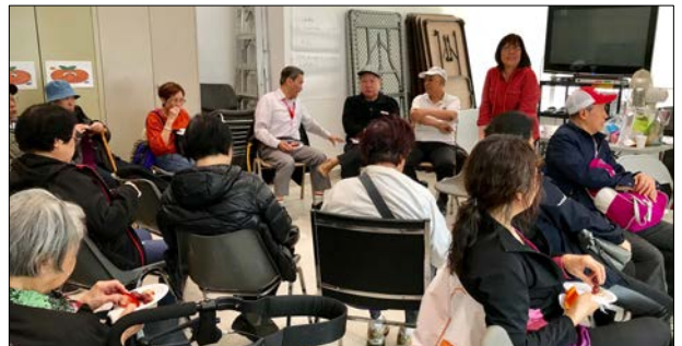
Buổi họp với thành viên người Việt trong cộng đồng về “Ngăn Chặn Cắt Giảm Pháp Trợ” ở Trung tâm Cộng đồng S.E.A.S .