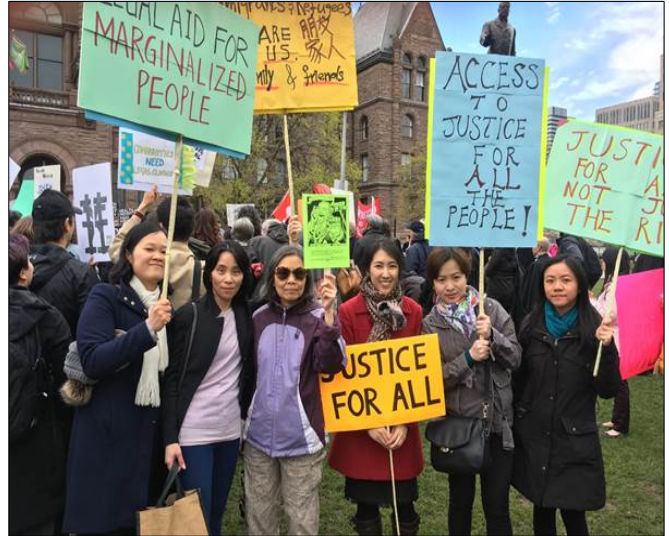
CSALC Staff participated in a general strike at Queen's Park

180 Dundas St. West, Suite 1701 Toronto, ON, M5G 1Z8 Telephone: 416-971-9674 Fax: 416-971-6780