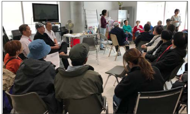
Buổi họp với thành viên người Hoa trong cộng đồng về “Ngăn Chặn Cắt Giảm Pháp Trợ” ở Trung tâm Cộng đồng S.E.A.S .

Thêm vào đó, những người phải tự biện sẽ khó chống lại phe đối lập được tài trợ tốt, thường là các cơ quan nhà nước có đại diện pháp lý giúp họ trình bày hợp lý. Điều này làm nghiêng cán cân công lý và tổn hại nguyên tắc tiếp cận công lý và bình đẳng. Các nghiên cứu cũng cho thấy với mỗi đô la chi cho các dịch vụ pháp trợ thì sẽ tiết kiệm được 6 đô la cho các lĩnh vực chi tiêu khác của chính phủ như vấn đề vô gia cư, sức khỏe, gia đình tan vỡ và tình trạng bị giam giữ.