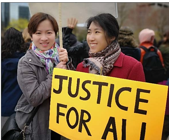
A CSALC staff lawyer and an articling student at a general strike on April 30, 2019 requesting "Access Justice for All".